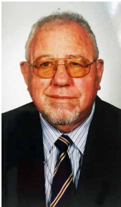
L'Ambasciatore Egone Ratzenberger (1935 – 2023). Velvyslanec Egone Ratzenberger (1935 – 2023).