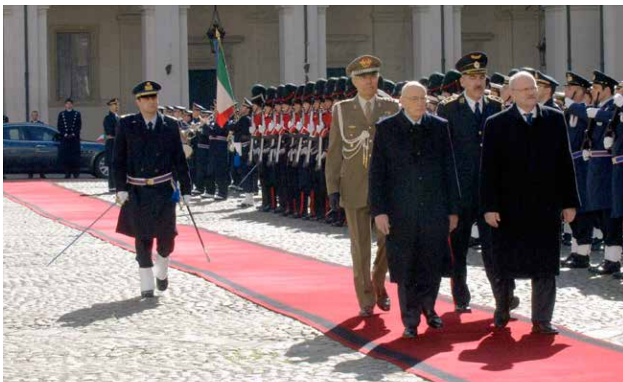
Visita di Stato del Presidente Ivan Gašparovič in Italia (27 febbraio – 1° marzo 2007). Štátna návšteva prezidenta Ivana Gašparoviča v Taliansku (27. februára – 1. marca 2007).