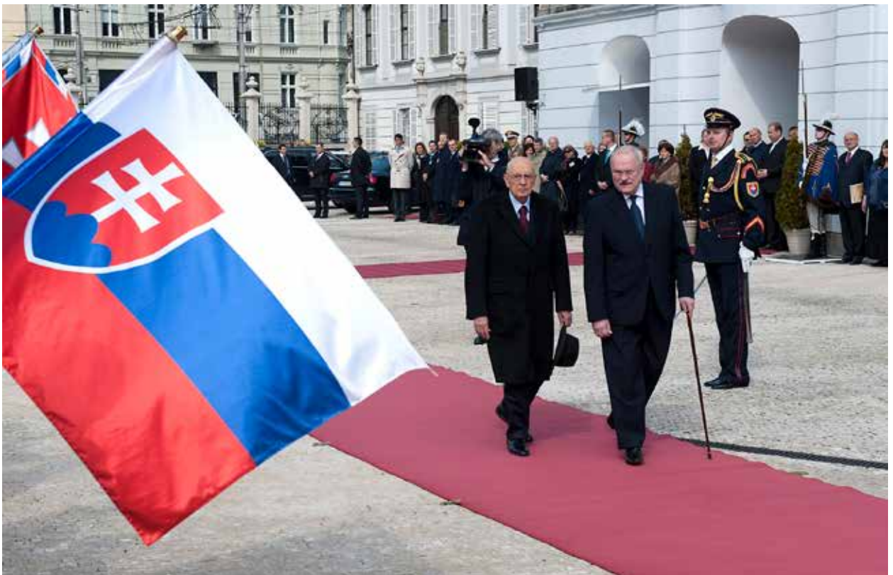
Visita ufficiale del Presidente Giorgio Napolitano in Repubblica Slovacca (15 aprile 2011). Oficiálna návšteva prezidenta Giorgia Napolitana v Slovenskej republike (15. apríla 2011).