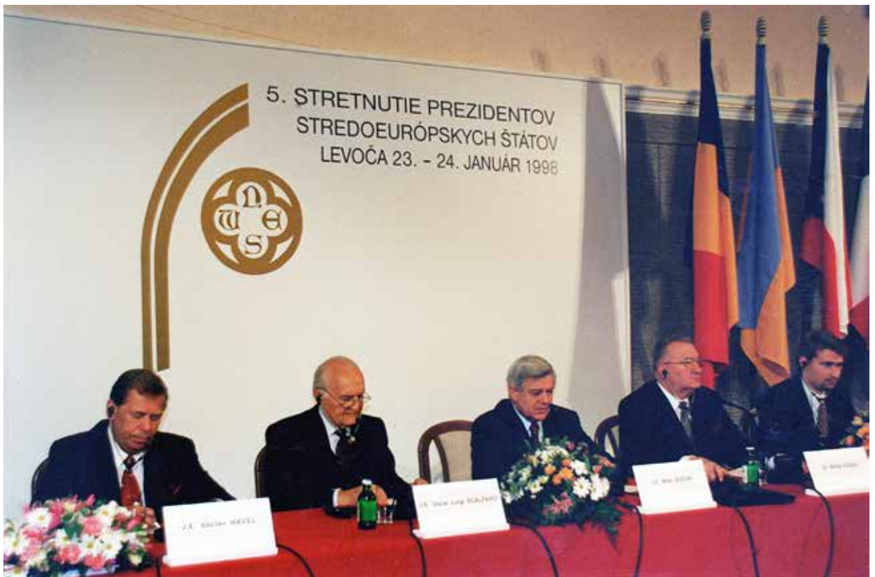
Il Presidente Scalfaro partecipa al vertice dei Capi di Stato dei Paesi Centro-Europei a Levoča (23 – 24 gennaio 1998). Prezident Scalfaro sa zúčastňuje na samite hláv štátov stredoeurópskych krajín v Levoči (23. – 24. januára 1998).