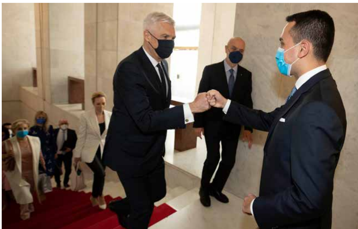
Il Ministro degli Affari Esteri e della Cooperazione Internazionale Luigi Di Maio riceve alla Farnesina il Ministro degli Affari Esteri ed Europei Ivan Korčok (6 maggio 2021). Minister zahraničných vecí a medzinárodnej spolupráce Luigi Di Maio prijíma vo Farnesine ministra zahraničných vecí a európskych záležitostí Ivana Korčoka (6. mája 2021).