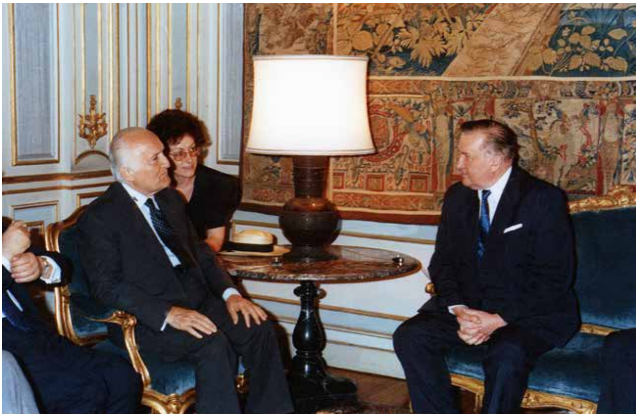
Il Presidente della Repubblica Oscar Luigi Scalfaro accoglie al Quirinale il Presidente Michal Kováč (8 giugno 1993). Prezident Talianskej republiky Oscar Luigi Scalfaro víta prezidenta Michala Kováča v Kvirinálskom paláci (8. júna 1993).