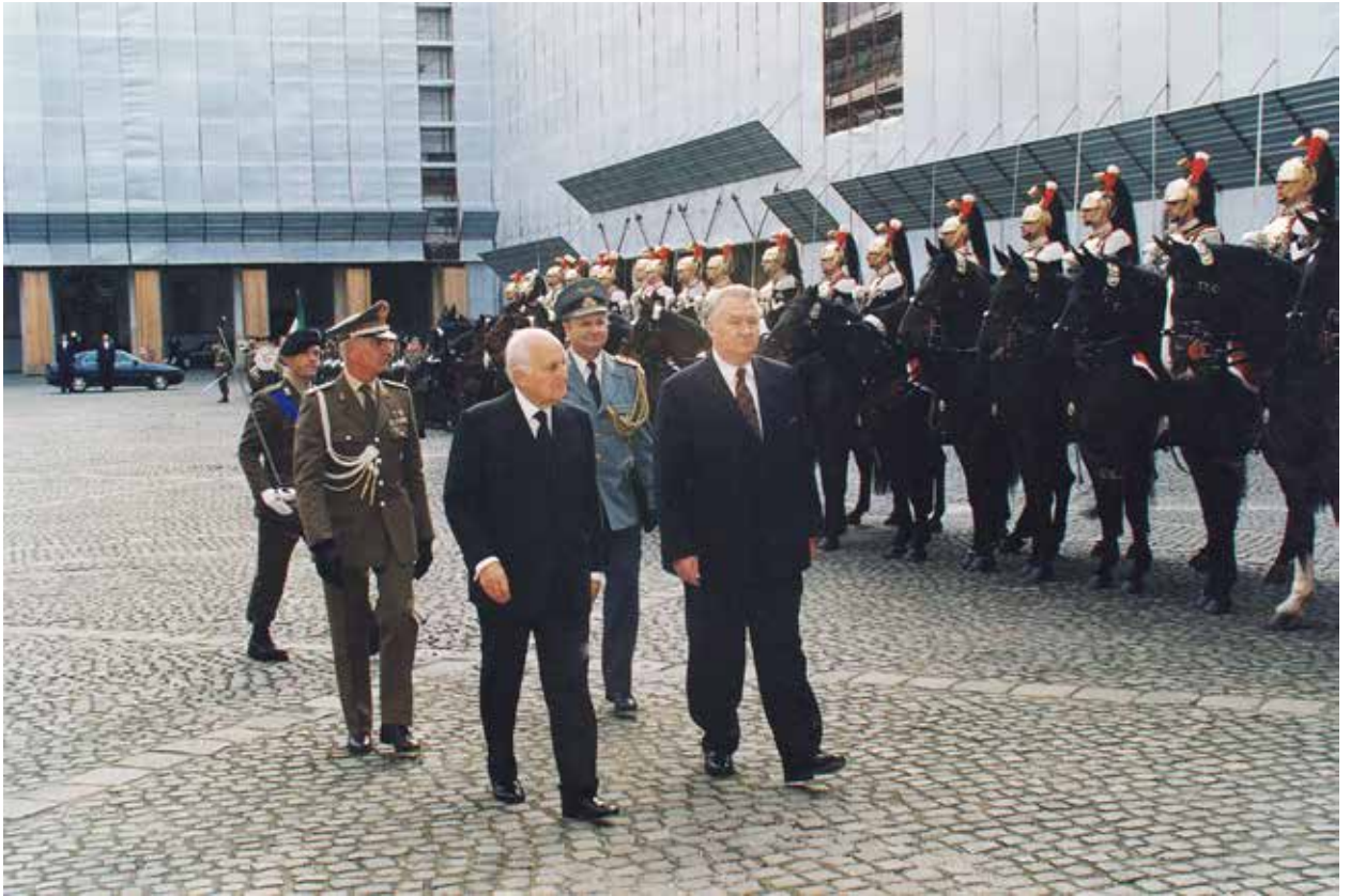
Visita ufficiale del Presidente Michal Kováč a Roma (19 novembre 1997). Oficiálna návšteva prezidenta Michala Kováča v Ríme (19. novembra 1997).