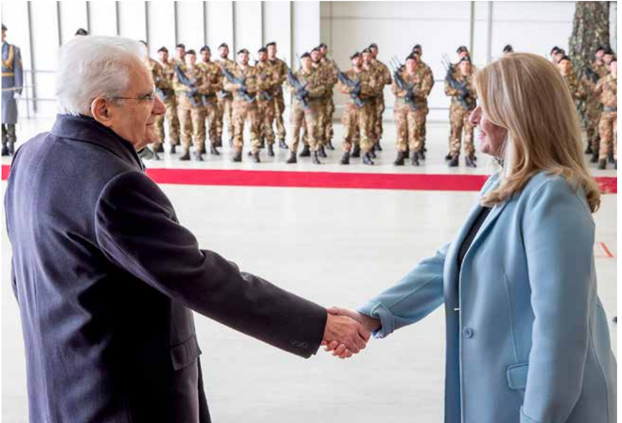
Visita del Presidente Mattarella e della Presidente Čaputová al contingente italiano presso la base di Kuchyňa-Malacky. Prezident Mattarella a prezidentka Čaputová na návšteve talianskeho kontingentu na základni Kuchyňa-Malacky.