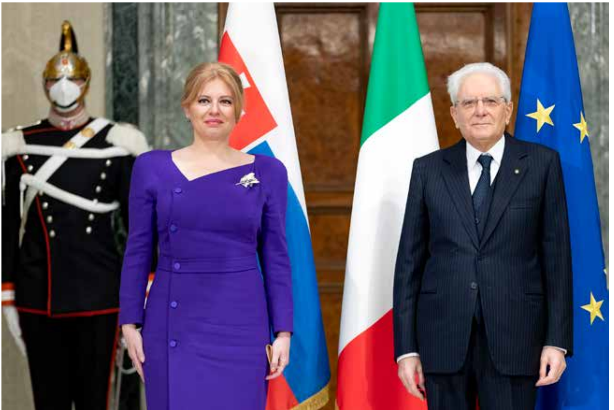
Il Presidente della Repubblica Sergio Mattarella accoglie la Presidente Zuzana Čaputová in visita ufficiale in Italia (20 – 21 aprile 2022). Prezident Talianskej republiky Sergio Mattarella víta prezidentku Zuzanu Čaputovú na oficiálnej návšteve Talianska (20. – 21. apríla 2022).