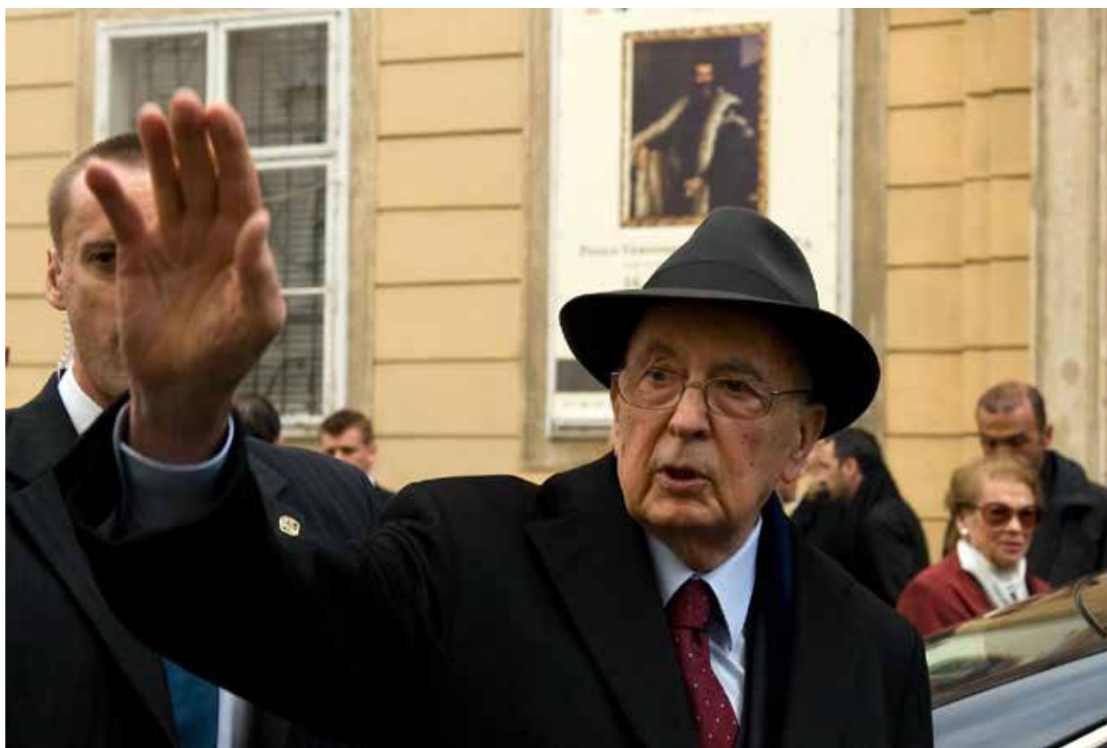
Visita ufficiale del Presidente Giorgio Napolitano in Repubblica Slovacca (15 aprile 2011). Oficiálna návšteva prezidenta Giorgia Napolitana v Slovenskej republike (15. apríla 2011).