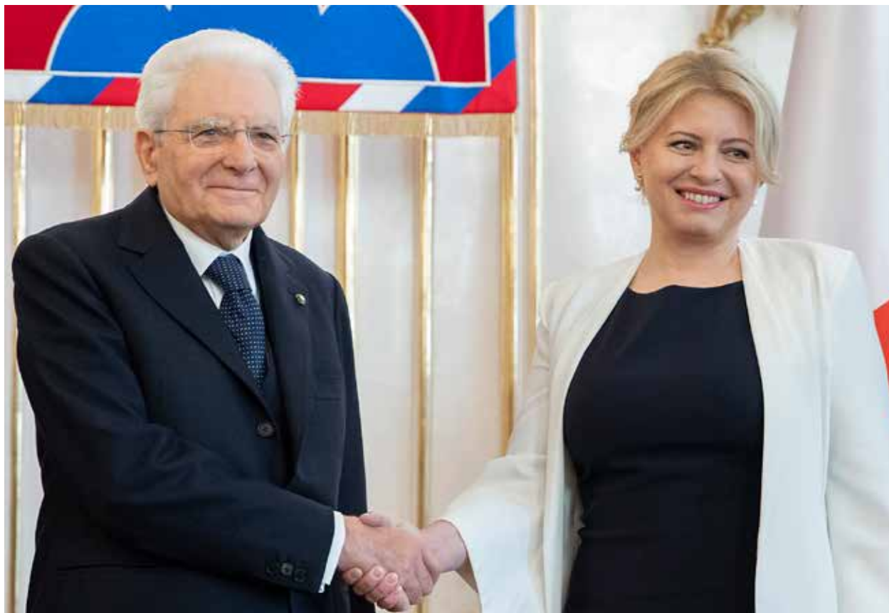
Incontro del Presidente Mattarella con la Presidente Čaputová. Stretnutie prezidenta Mattarellu s prezidentkou Čaputovou.