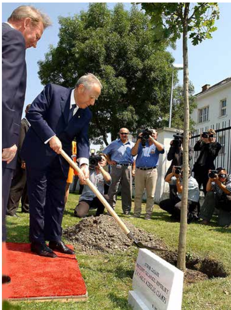
Il Presidente Ciampi pianta un albero commemorativo nel giardino del Palazzo Presidenziale. Prezident Ciampi sadí v záhrade Prezidentského paláca pamätný strom.