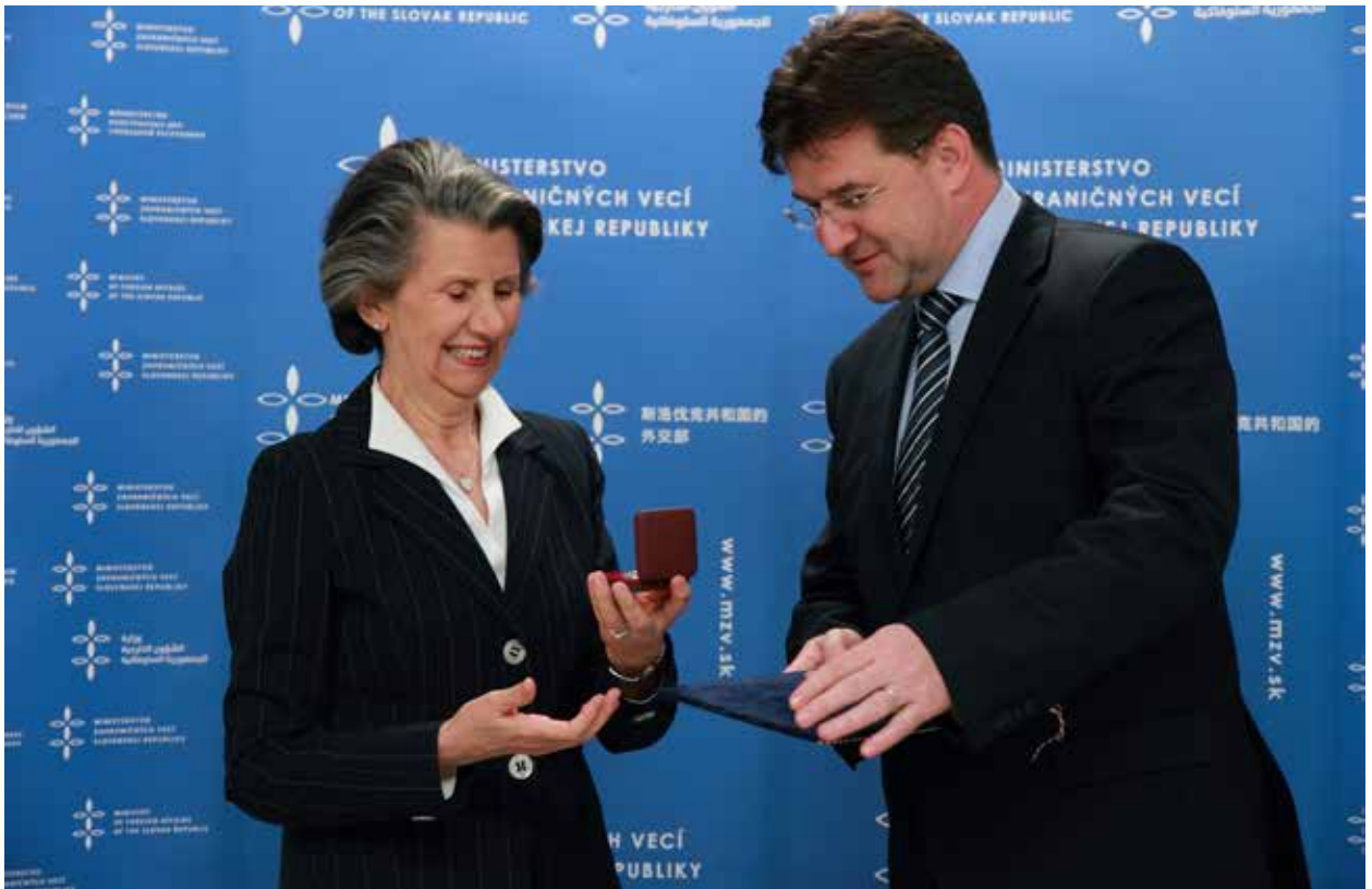
Il Ministro degli Esteri e Vice Primo Ministro Miroslav Lajčák saluta l'Ambasciatore Brunella Borzi al termine del suo incarico a Bratislava (maggio 2012). Minister zahraničných vecí a podpredseda vlády Miroslav Lajčák sa lúči s veľvyslankyňou Brunellou Borzi na záver jej pôsobenia v Bratislave (máj 2012).