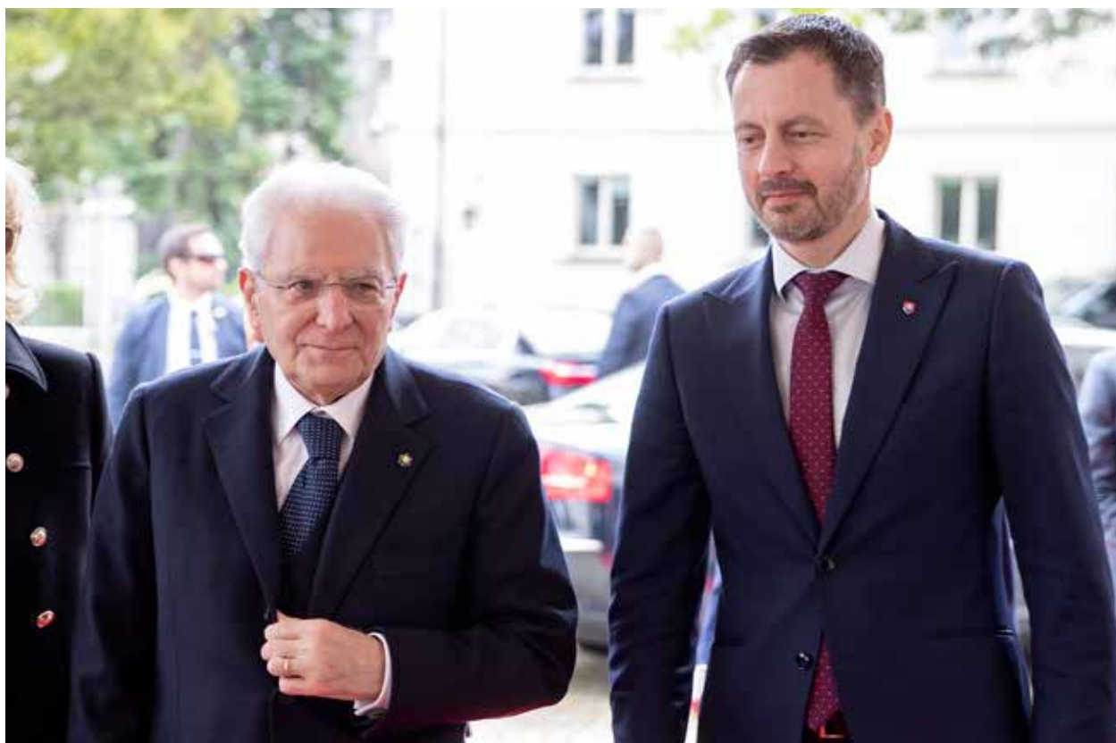
Il Primo Ministro Eduard Heger accoglie il Presidente Sergio Mattarella all'Ufficio del Governo. Predseda vlády Eduard Heger víta prezidenta Mattarellu na Úrade vlády.