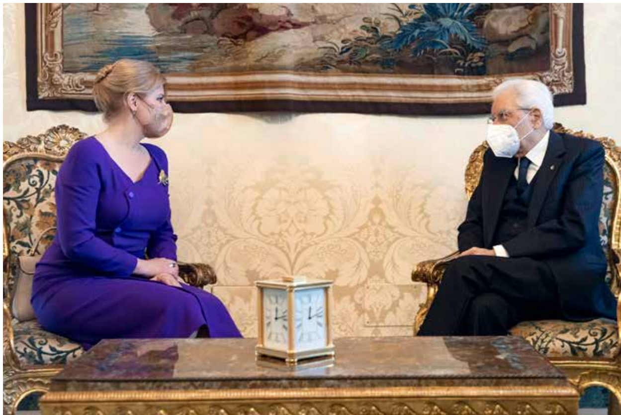
Colloquio al Quirinale tra il Presidente Sergio Mattarella e la Presidente Zuzana Čaputová. Rozhovor prezidenta Sergia Mattarellu s prezidentkou Zuzanou Čaputovou v Quirinale.