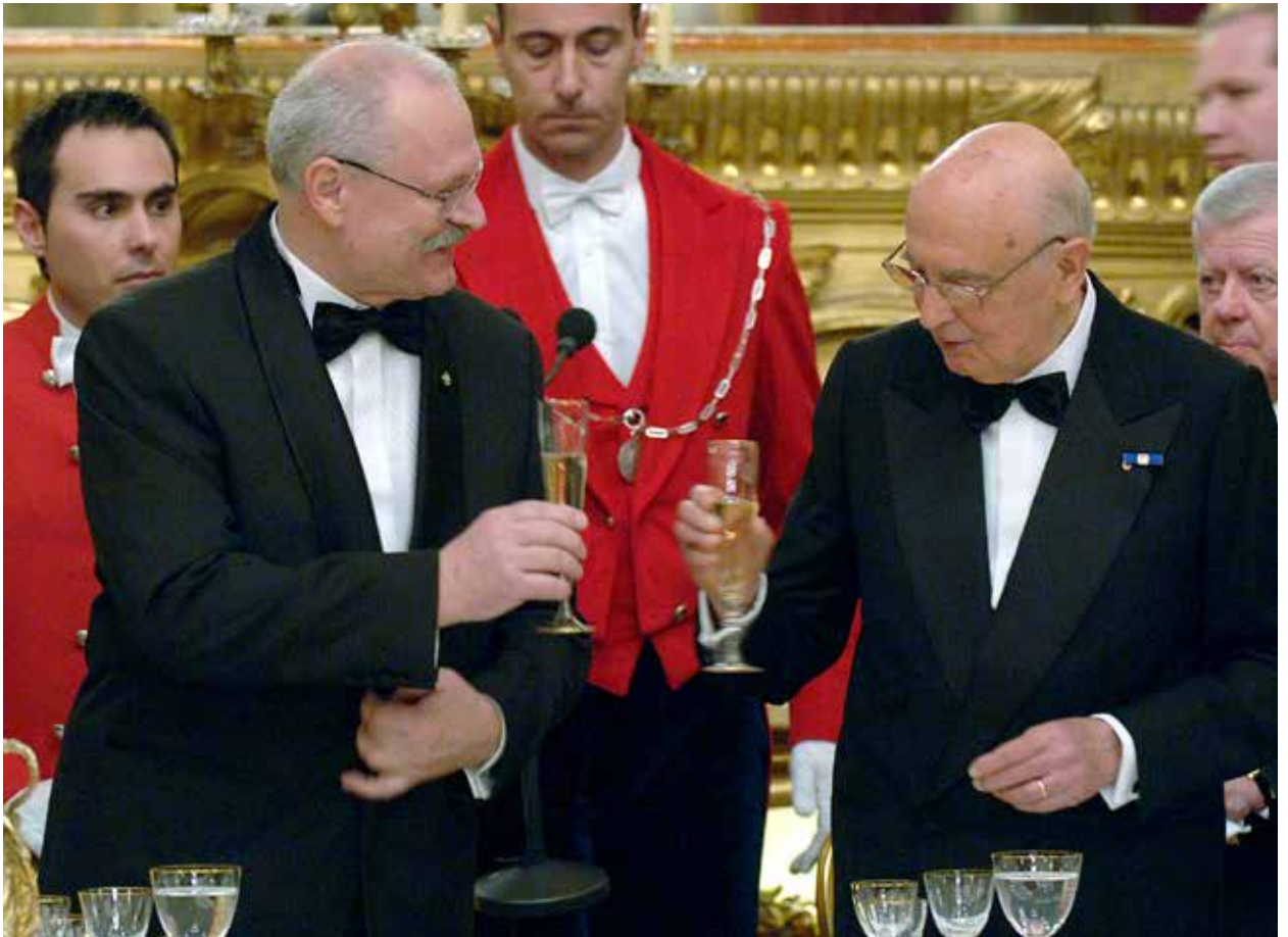
Il Presidente della Repubblica Napolitano ed il Presidente Gašparovič durante il pranzo di gala al Quirinale. Prezident Talianskej republiky Napolitano a prezident Gašparovič počas slávnostného obeda v Kvirinálskom paláci.