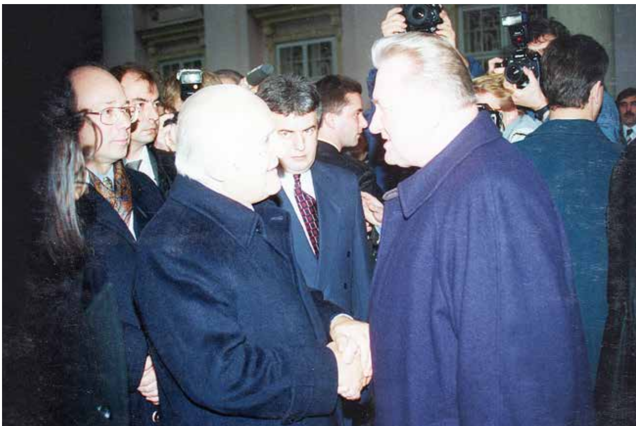
Il Presidente della Repubblica Oscar Luigi Scalfaro con Il Presidente Michal Kováč a Bratislava (29 novembre 1994). Prezident Talianskej republiky Oscar Luigi Scalfaro s prezidentom Michalom Kováčom v Bratislave (29. novembra 1994).