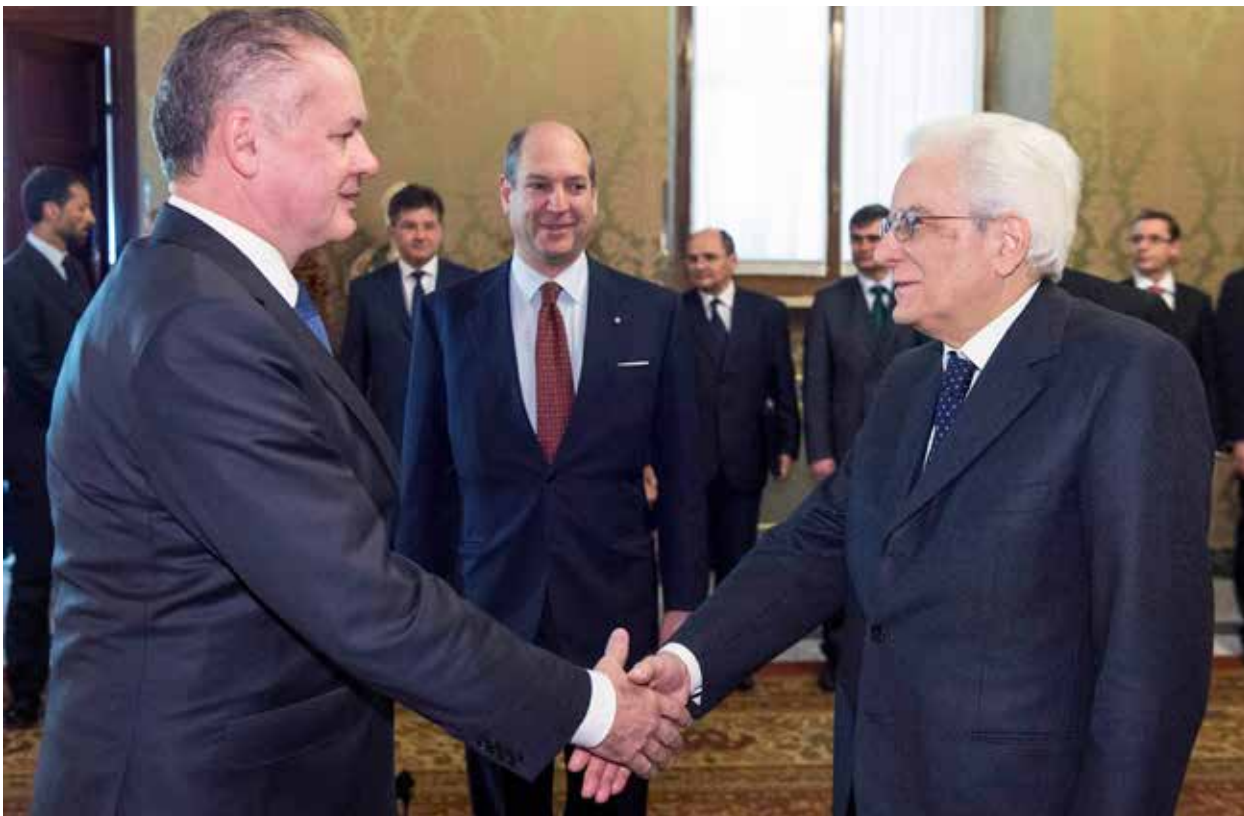
Il Presidente della Repubblica Sergio Mattarella accoglie il Presidente Andrej Kiska in visita a Roma (4 aprile 2015). Prezident Talianskej republiky Sergio Mattarella víta prezidenta Andreja Kisku na návšteve Ríma (4. apríla 2015).