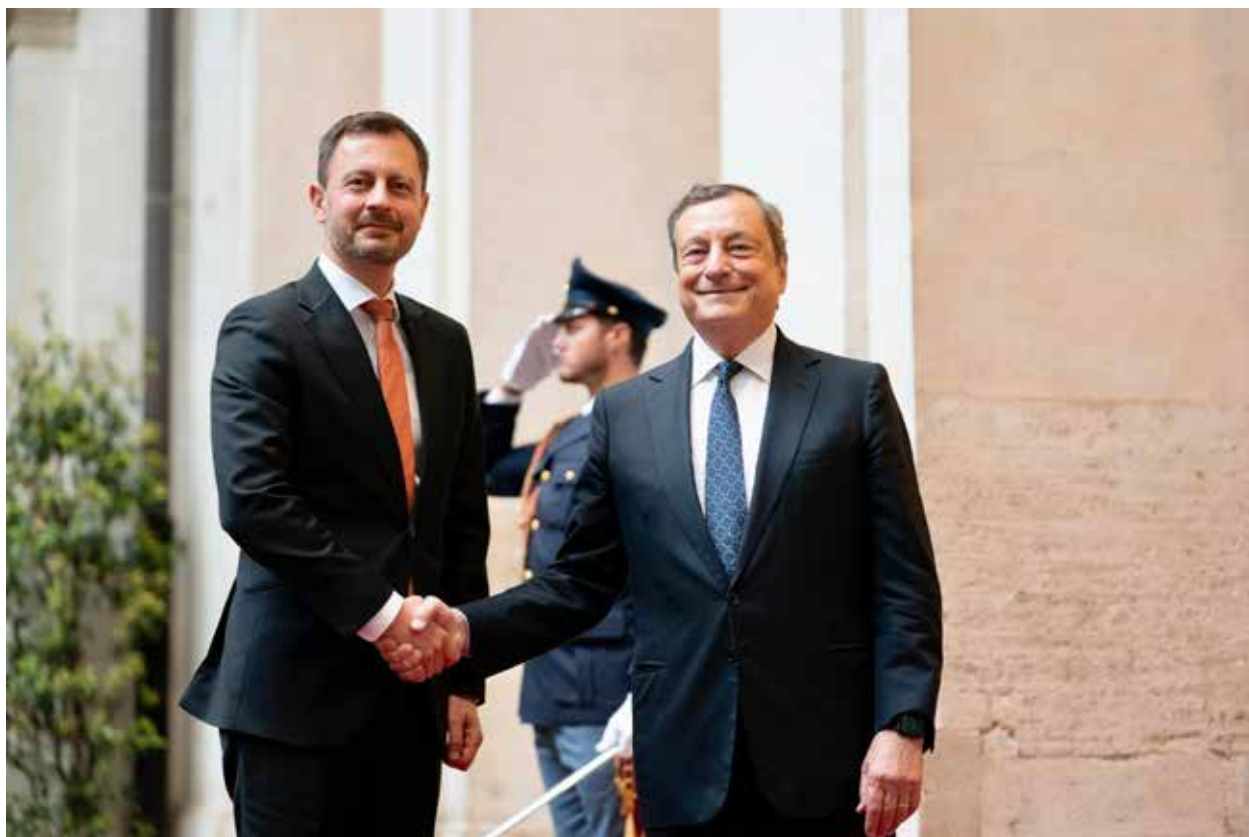
Il Primo Ministro Eduard Heger accolto dal Presidente del Consiglio Mario Draghi a Palazzo Chigi (8 settembre 2022). Predseda vlády Mario Draghi víta predsedu vlády Eduarda Hegera v Palazzo Chigi (8. septembra 2022).