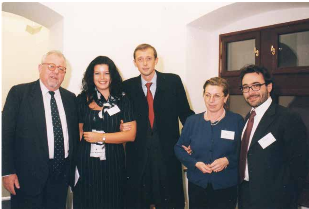
Missione in Slovacchia del Ministro del Commercio Estero, Piero Fassino. Nella foto l'Ambasciatore Ratzenberger e il personale dell'Ufficio ICE di Bratislava (12 – 14 ottobre 1999). Misia ministra zahraničného obchodu Piera Fassina na Slovensku. Na snímke veľvyslanec Ratzenberger a zamestnanci kancelárie ICE v Bratislave (12. – 14. októbra 1999).